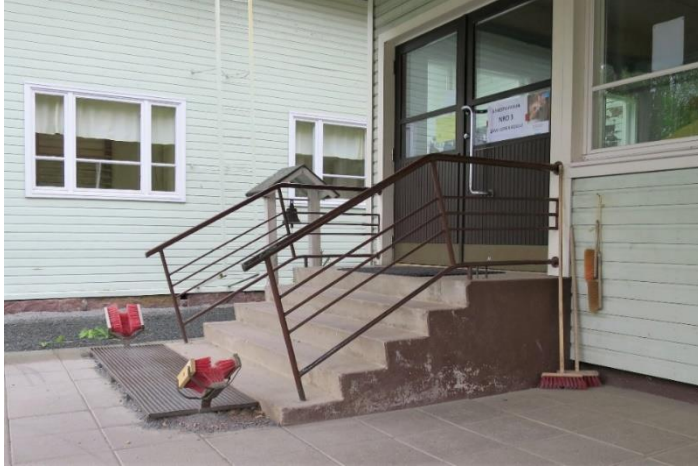
Kuva 6. Äänestyspaikan ulko-ovelle johtava portaikko

Topenon äänestysalueen äänestyspaikkana oli Länsi-Lopen koulu, joka sijaitsi vanhassa puurakennuksessa. Opaste äänestyspaikalle oli vasta koulun pääovella. Pihalla ei ollut merkittyä invapysäköintipaikkaa. Piha-alue oli pääasiassa soraa, mutta sisäänkäynnin edessä oli laatoitettu alue. Äänestyspaikan sisäänkäynti ei ollut esteetön portaikon vuoksi. Pyörätuolilla ei pääsyt sisälle omatoimisesti, eikä turvallisesti avustettunakaan.