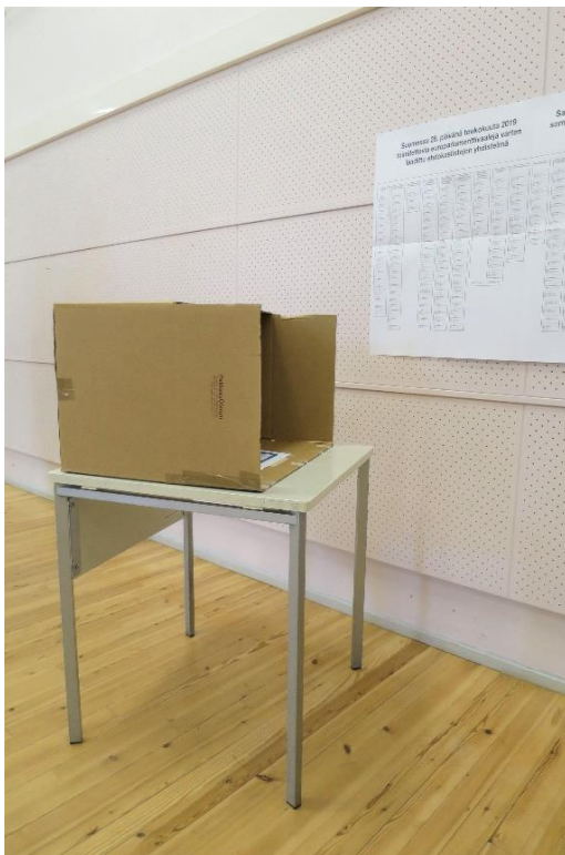
Kuva 5. Äänestyspaikka liikuntaesteisille

Äänestyspaikalla oli kaksi nimettyä vaaliavustajaa, joista vaalilautakunnan puheenjohtajan mukaan toinen oli aina mies ja toinen nainen. Puheenjohtajan kertoman mukaan vaaliavustajien käyttö oli ollut vähäistä. Edellisissä eduskuntavaaleissa äänestäjä oli tarvinnut apua vaaliavustajilta 2-3 kertaa ja yhtä monta kertaa äänestäjä oli käyttänyt valitsemaansa omaa avustajaa. Saadun tiedon mukaan avustajan käytöstä tehdään merkintä vaalipöytäkirjaan.