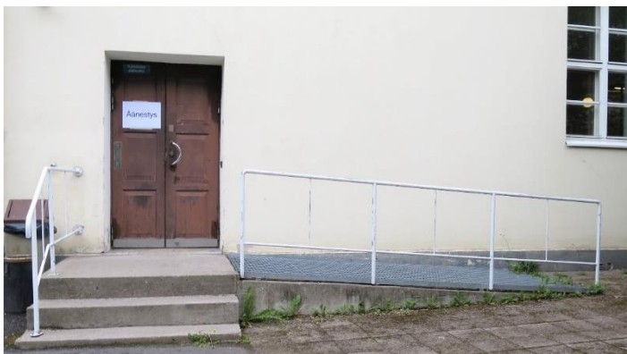
Kuva 4. Luiska sisäänkäynnille

Takaovelle johti luiska, jonka kaltevuus oli noin 5 astetta (n. 8,7 prosenttia). Rakennuksen esteettömyydestä annetun valtioneuvoston asetuksen, joka koskee luvanvaraista uudis- ja korjausrakentamista, 2 §:n 2 momentin mukaan luiskan kaltevuus saa olla enintään viisi prosenttia ja tietyssä asetuksessa määritellyssä tilanteessa enintään 8 prosenttia. Ulkotilassa luiska saa kuitenkin olla kaltevuudeltaan yli viisi prosenttia vain, jos se voidaan pitää sisätilassa olevaan luiskaan verrattavassa kunnossa.