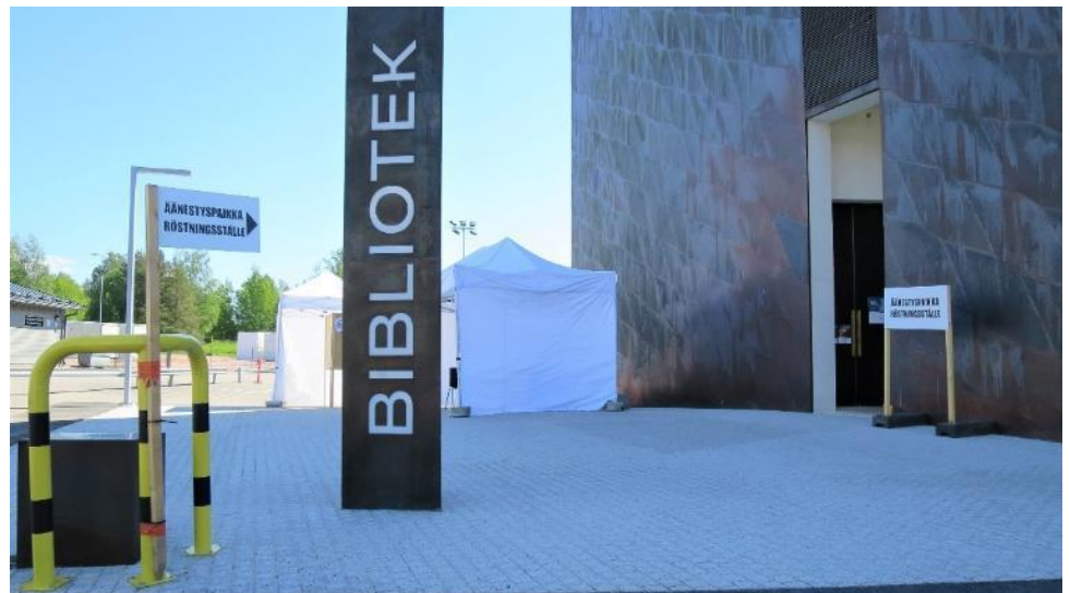
Kuva 14. Ulkoäänestyseltiltä ja sisäänkäynti Kirkkonummella

Opasteita oli sijoitettu ainoastaan äänestyspaikan lähetyville. Opasteet olivat suomeksi ja ruotsiksi. Vaalitoimitsija kertoi, että ensimmäisenä päivänä saadun palautteen johdosta oli lisätty opasteita ohjaamaan äänestäjiä kirjaston pääovelta ennakoäänestyspaikan sisäänkäynnille.