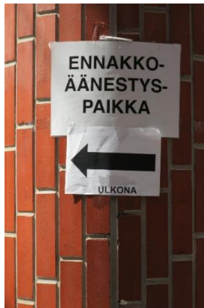
Kuva 1. Opaste / viitoitus

Ulkoäänestyspaikkana oli Tampereen Hervannassa sijaitsevan kaupakeskus Duon Pietilänkadun puoleinen parkkipaikka. Äänestyspaikka oli keskeisellä paikalla hyvien kulkuyhteyksien varrella, johon myös saattoliikenteen oli helppo päästä. Pysäköintitilaa oli runsaasti äänestyspaikan ympärillä sekä välittömässä läheisyydessä sijaitsevan kaupakeskuksen pohjakerroksessa. Pohjakerroksesta pääsi hissillä kaupakeskukseen, jonka pääkäytävälle oli sijoitettu äänestyspaikalle johtavat opasteet. Muualla kauppakeskuksessa tai sen parkkihallissa opasteita ei havaittu.