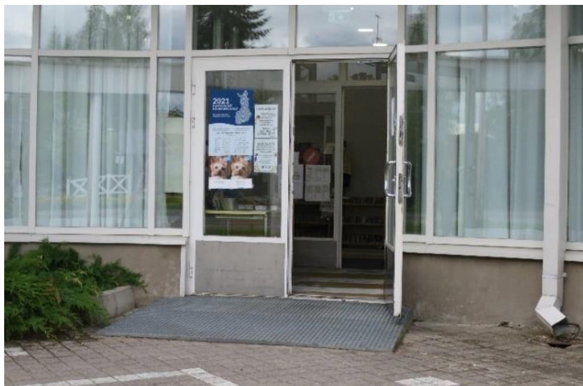
Kuva 8. Sisäänkäynti äänestyspaikalle / Lammin kirjastoon

Äänestyspaikalla oli käytössä antibact-kynät, joita ei vaalitoimitsijoiden mukaan tarvitse erikseen desinfioida.