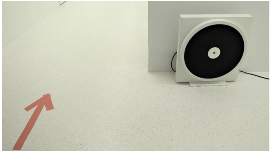
Kuva 16. Yksisuuntainen kulku ja ilmanpuhdistin Kirkkonummella

Vaalitoimitsija kertoi, että äänestysmerkinnän tekemisessä käytettäviä kyniä ja pinnat desinfioidaan ”vähän väliä”. Sisälle äänestyspaikkaan oli sijoitettu myös runsaasti ilmanpuhdistajia, jotka vaalitoimitsijan mukaan oli nimenomaisesti tarkoitettu ”tappamaan viruksia”.