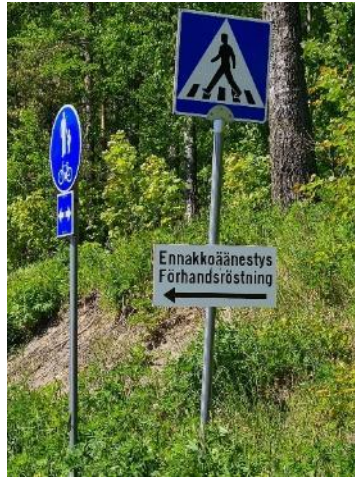
Kuva 21. Viitoitus

Tarkastuksen toimittajien havaintojen mukaan suomen- ja ruotsinkieliset opasteet (myös kadunvarsiopasteet) ennakköäänestyspaikalle oli sijoitettu hyvin ja niitä oli riittävästi.