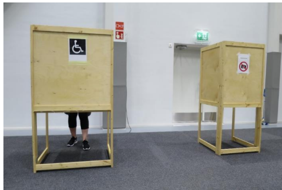
Kuva 11. Äänestyskopit Janakkalassa

Äänestyspaikassa oli kaksi äänestyskoppia, joista toinen oli esteetön (leveys 89 cm / pöydän korkeus 74 cm). Vallitsevan koronatilanteen vuoksi äänestyksen kulku oli järjestetty ja opastettu yksisuuntaiseksi. Koska opastetulla ulosmenoreitillä oli portaat, liikuntaesteiset henkilöt ohjattiin pääovesta ulos.