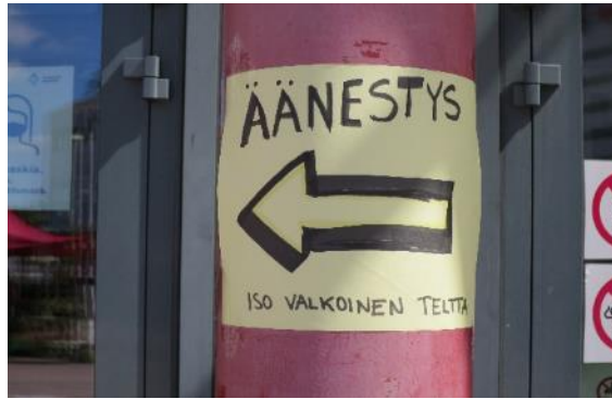
Kuva 17. Opasteviitta kirjaston edessä

Läheisen kirjaston edessä olevassa pylväässä oli yksi – käsinkirjoitettu ja vaikeasti havaittava – opaste äänestyspaikalle. Kyseinen opaste oli vain suomeksi. Kauppakeskuksessa tai Paalutorilla ei tarkastajien havaintojen mukaan ollut muita opasteita äänestyspaikalle.