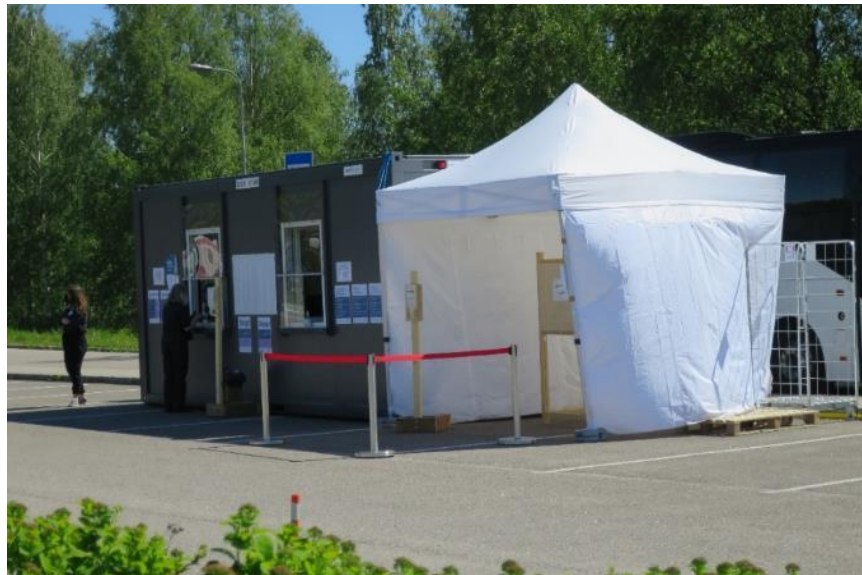
Kuva 23. Ulkoäänestysteltoa ja vaalitoimitsijoiden kontti

Ulkoäänestyspaikassa oli mahdollista äänestää myös teltassa, jossa oli yksi äänestyskoppi (kopin leveys 76 cm, pöydän korkeus 99 cm). Saadun tiedon mukaan paikalla kävi äänestäjiä jalkaisin tai pyöräillen.