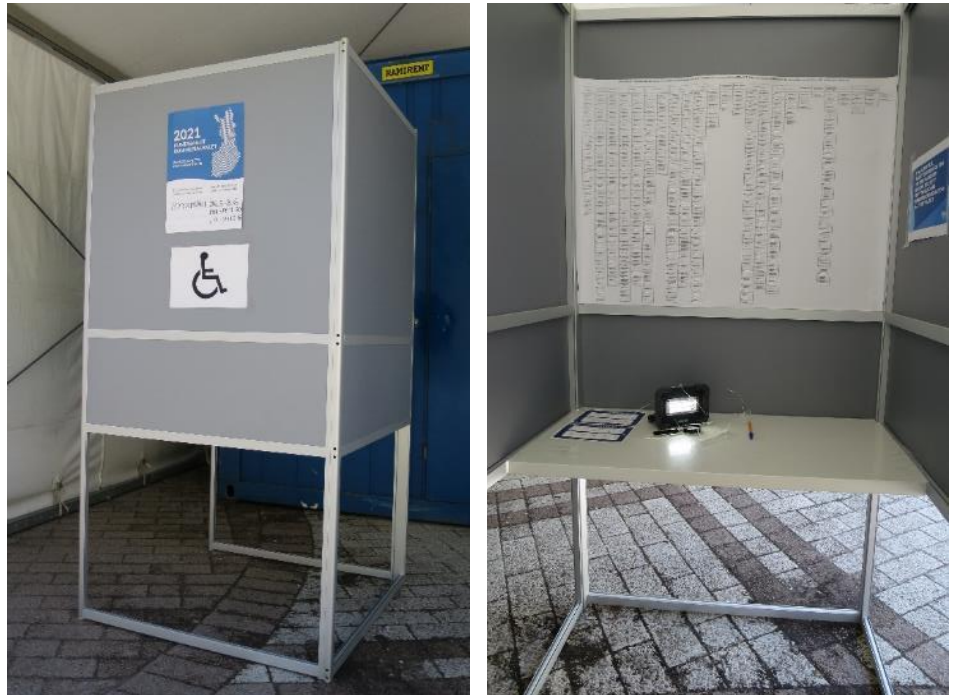
Kuvat 19 ja 20. Esteetön äänestyskoppi Vantaalla

Äänestysteltassa oli kaksi äänestyskoppia, joista toinen soveltui pyörätuolia ja muita liikkumisen apuvälineitä käyttävälle (kopin leveys 103 cm, pöydän korkeus 72 cm). Tässä äänestyskopiassa oli erillinen valaisin sekä suurennuslasi heikkonäköisiä äänestäjiä varten.