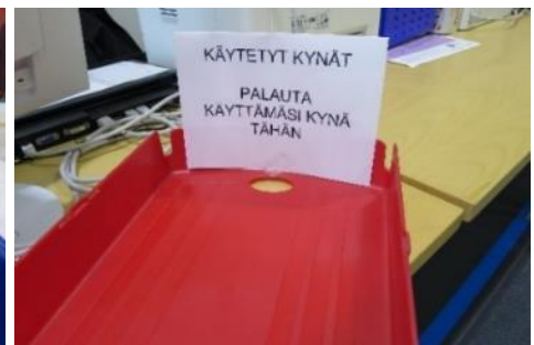
Kuvat 5 ja 6. Kynälokerot