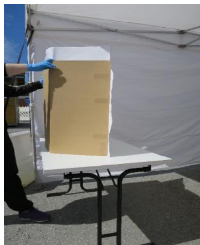
Kuva 2. Näkösuoja

Havaintojen mukaan vaalitoimitsijoita oli tarkastushetkellä ainakin neljä. Vaalitoimitsijat olivat avustaneet apua pyytäneitä henkilöitä äänestystapahtumassa. Liikuntaesteisillä ja ikääntyneillä äänestäjillä oli ollut mukanaan myös omia avustajia. Saadun tiedon mukaan oman avustajan käytöstä oli tehty oikeusministeriön vaaliohjeen mukaiset merkinnot äänestäjistä pidettävään luetteloon.