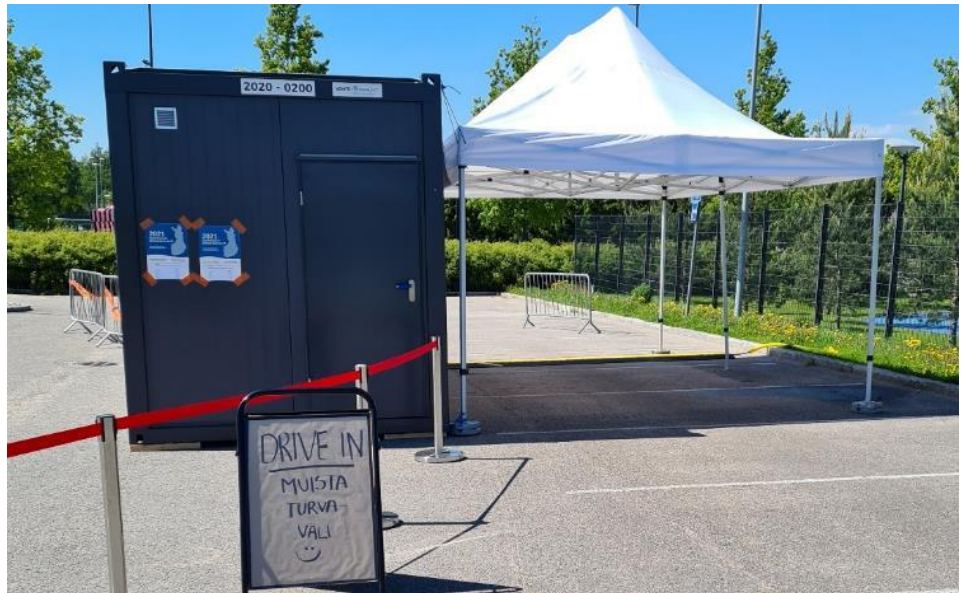
Kuva 22. Drive-in -äänestys Espoon Leppävaarassa

Autoilijoille suunnattu drive-in-äänestystapa (yhden luukun -periaate) oli vaalitoimitsijan mukaan saanut kiitosta erityisesti liikuntaesteisiltä äänestäjiltä.