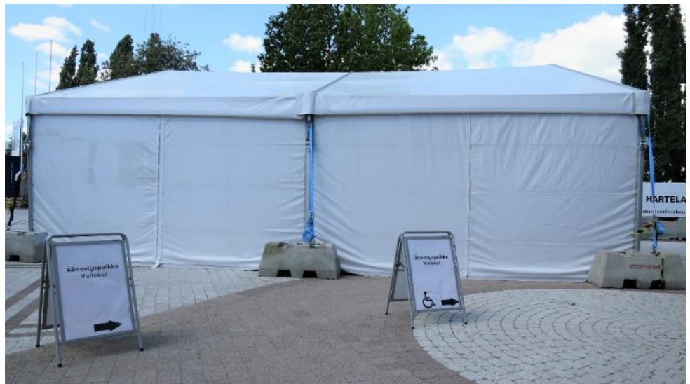
Kuva 18. Ulkoäänestysteltta Myyrmäen Paalutorilla

Vantaan kaupungin verkkosivuilla äänestyspaikaksi oli merkitty ” Myyrmäen kirjasto, Paalutori 3, ulkoäänestys”. Vaalitoimitsijalta saadun tiedon mukaan monet äänestäjät ovat menneet ensin kirjastoon ja vasta sieltä heidät on ohjattu Paalutorin laidalla sijaitsevaan äänestystelttaan. Tarkastuksen toimittajien havaintojen mukaan opastuksen selkeyttäminen ja parantaminen ei olisi vaatinut kohtuuttoman suuria toimenpiteitä.