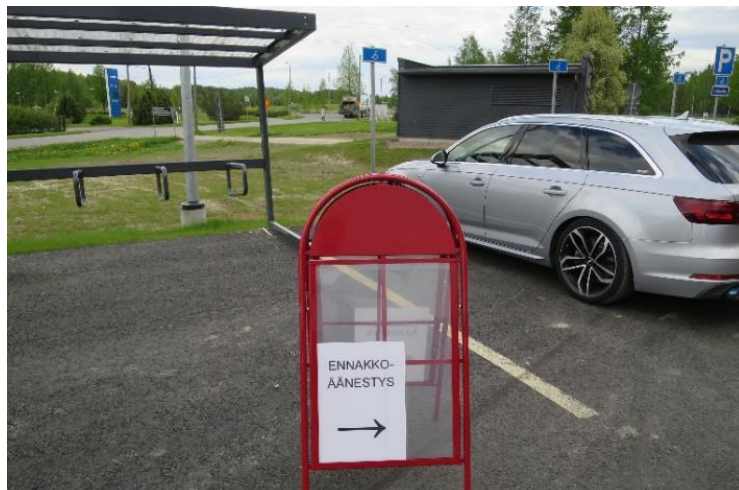
Kuva 10. Invapysäköinnistä opastus äänestyspaikalle

Äänestyspaikkana oli Janakkalan Tervakoskella sijaitseva Delfort Areena / Tervakosken liikuntahalli. Halli on valmistunut tammikuussa 2021 ja alueen pihatyöt olivat osittain keskeneräisiä. Saattoliikenne pääsee äänestyspaikan läheisyyteen. Hallin vieressä oli neljä, selkeästi merkittyä invapysäköintipaikkaa ja niiden kohdalla piha oli jo asfaltoitu. Ensimmäiset opasteet ennakoäänestyspaikalle oli sijoitettu heti invapysäköintipaikkojen viereen.