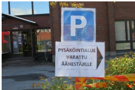
Kuva 12. Pysäköinti äänestäjille

Äänestyspaikkana oli Siuntiossa sijaitseva Työpaja Virta, joka on Siuntion ainut yleinen ennakoäänestyspaikka.