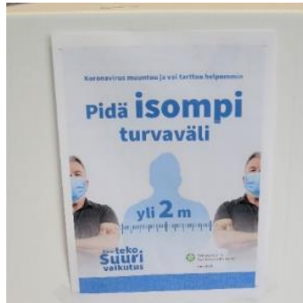
Kuva 24. Turvavälit

Kirkkonummella terveysturvallisuuteen oli edellä kohdassa 2 kuvatulla tavalla panostettu erityisesti lukuisien ilmanpuhdistimien avulla.