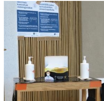
Kuva 25. Käsidesiä ja maskeja