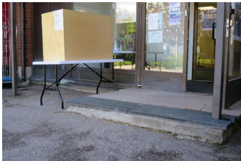
Kuva 13. Esteellinen sisäänkäynti ja ulkoäänestys Siuntiossa

Äänestystilan esteettömyyttä koskeva Siuntion kunnan hallintojohtajan alustava selvitys ja oikeusasiamiehen arviointi ilmenevät tarkastuspöytäkirjan kohdasta 3 ja toimenpiteet kohdasta 4.