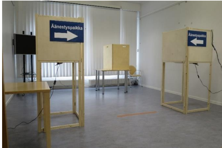
Kuva 9. Äänestyskopit Lammilla

Äänestystila oli selkeästi erillään kirjaston muista tiloista. Äänestyspaikassa oli kolme äänestyskoppia, joista yksi oli esteetön (leveys n. 80 cm / pöydän korkeus 74 cm). Esteettömässä äänestyskoppissa ei ollut erillistä valaisinta, toisin kuin kahdessa muussa. Äänestystilassa, äänestyskoppien takana oleva suuri ikkuna oli peitetty verhoilla vaalisalaisuuden suojaamiseksi.